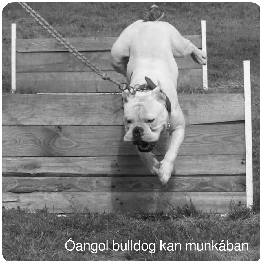
Óangol bulldog kan munkában

divathullám még rontott az angol bulldog helyzetén és megítélésén. Sok ember ma a bulldog szó hallatán a kicsi, szuszogó-szörcsögő (légzési nehézséggel küzködő) betegségekkel terhelt gnómra gondol elsősorban. A sok negítívum mellett szerencsére sokan tiszteletből és elkötelezettségből egy csomó elszántsággal, kitartással úgy gondolták, hogy ebbe nem törődnek bele és változtatnak a bulldog helyzetén, kialakítják a ma elérhető ősbulldog leszármazottakból (amerikai pit bull terrier, amerikai bulldog, bullmasztiff stb.) azt a fajtát amely méltán viselheti majd az óangol bulldog nevet. A következő országok már saját néven tenyésztik az ősi típushoz inkább közelálló fajtát: Az USA létrehozta a Leavitt-féle Old English Bulldogot, Ausztrália az Aussie Bulldogot, Európában Svájc, az Angehrn-